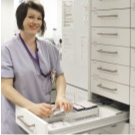
PharmaOrg 2 -lääkelaatikosto