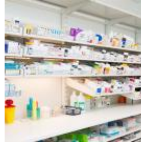
Lääkehyllyjärjestelmä keskussairaalan vuodeosaston lääkehuoneessa