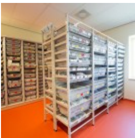
Modul iT -hyllyjärjestelmä