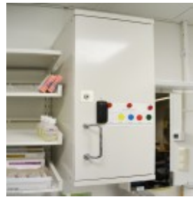
Huumekaappi sähkölukolla ja kulunvalvonnalla