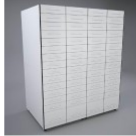
Rombic Flat Draw -lääkelaatikosto